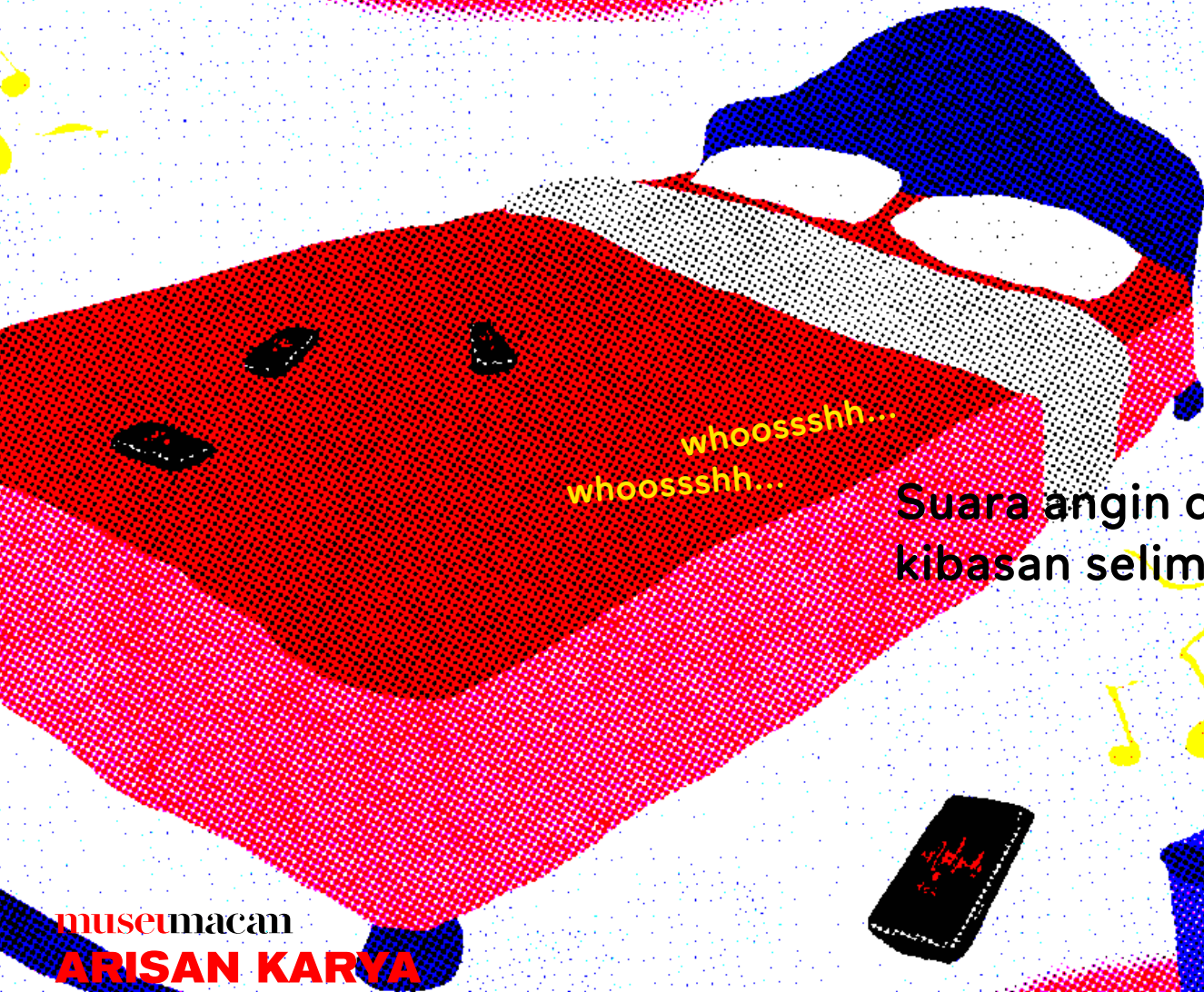
Suara angin dari kibasan selimut