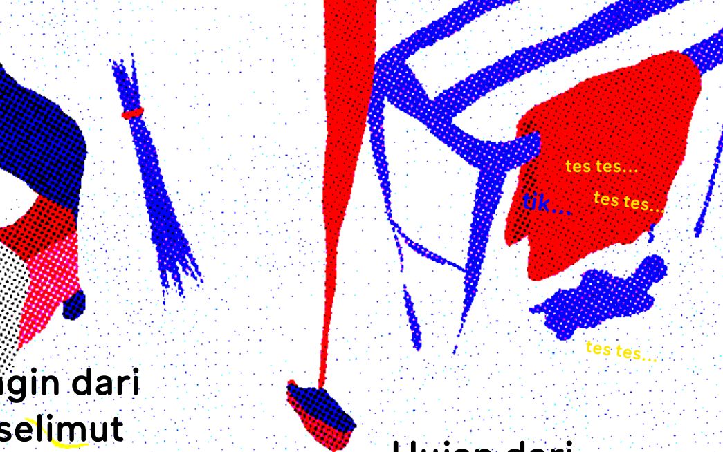
Hujan dari gorengan telur