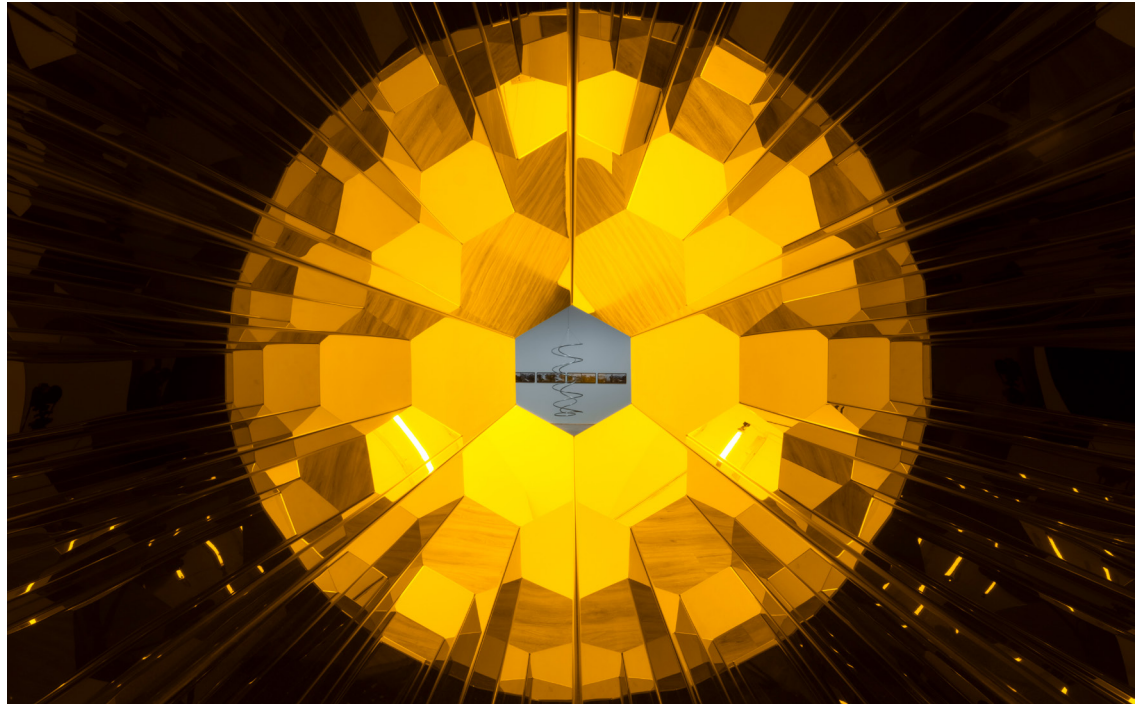
Multiverses and futures (2017) Installation view: Olafur Eliasson: Your curious journey, Museum MACAN, Jakarta, 2025. Private collection © 2017 Olafur Eliasson

Latihan ini mengajak peserta didik melihat lebih dekat tentang cahaya dan warna serta bagaimana pola-pola geometris terbentuk dari pembiasan cahaya.