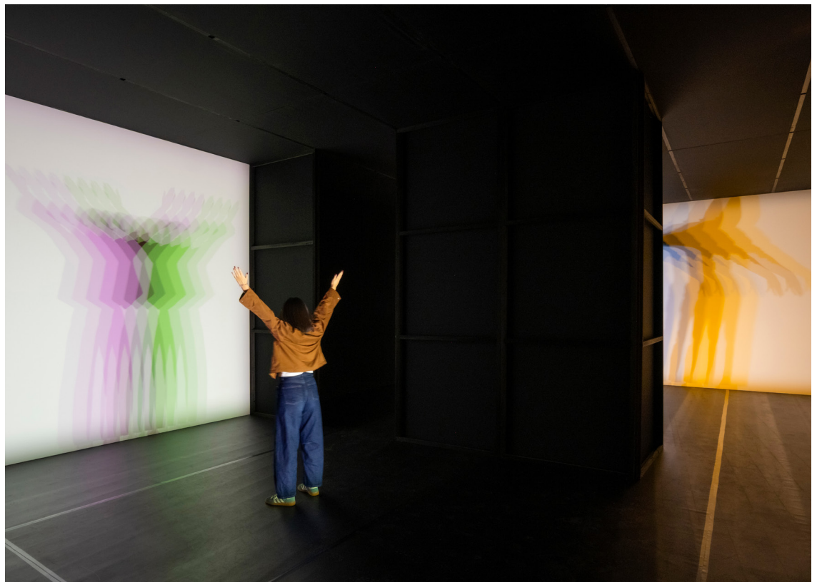
Multiple shadow house (2010), Installation view: Olafur Eliasson: Your curious journey, Museum MACAN, Jakarta, 2025. Photo: Liandro Siringoringo. Courtesy of Museum MACAN. Courtesy of Olafur Eliasson; neugerriemschneider, Berlin; Tanya Bonakdar Gallery, New York © 2010 Olafur Eliasson