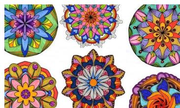
© Jessica Gamlin, Islamic Geometric, Pinterest.